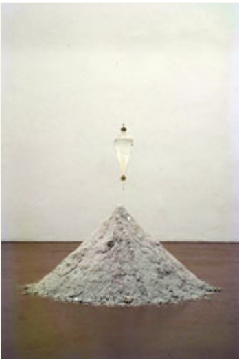
Dove Bradshaw Negative Ions II , 1996 Salz, 1000 ml- Scheidetrichter, Wasser Größe variabel