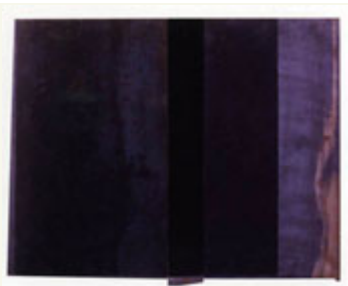
Merrill Wagner Untitled , 2006 Rostschutzfarbe auf Stahl Ca. 52 x 62 cm

Strategien noch einmal zu vermessen. Minimal war keine feste Methode, es war taktische Praxis, und das sieht man bei Rehbein genau.