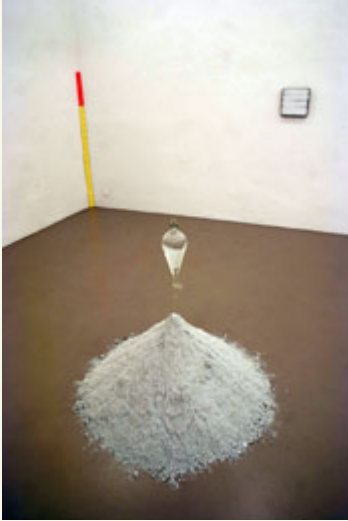
Ausstellungsansicht Thomas Rehbein Galerie, Köln